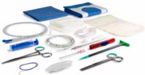
drainova® ArgentiC Katheter-Set plus Art. Nr. 1260