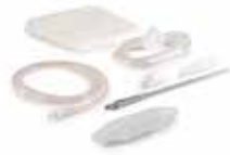
drainova® ArgentiC Katheter-Set compact Art. Nr. 1240