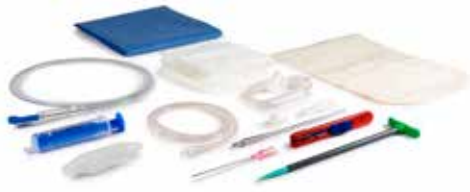
drainova® ArgentiC Katheter-Set classic Art. Nr. 1250